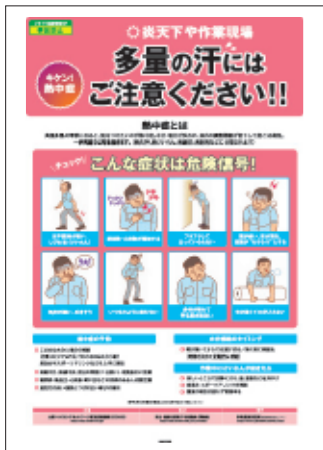
4 熱中症対策 症状と予防法、 水分補給、対処法を解説