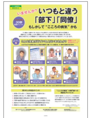
6 ストレス対策② (周囲チェック編) 周りの人の気づきチェックと 対応ポイントを解説