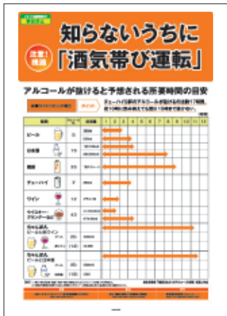
1 残酒対策 酒類と量で アルコール代謝を解説