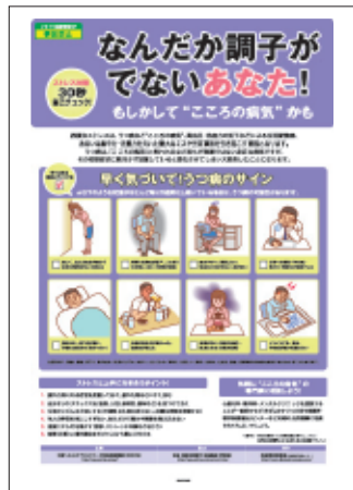
5 ストレス対策① (自己チェック編) 自己で行ううつ病の 前兆チェックと対処法を解説