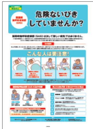
2 睡眠時無呼吸症候群 (SAS) 対策 SASの症状と影響・予防策を解説