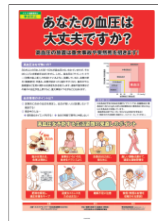
7 高血圧対策 生活習慣の見直し ポイントを解説