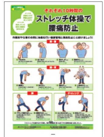
3 腰痛対策 手軽にできる ストレッチ体操を解説